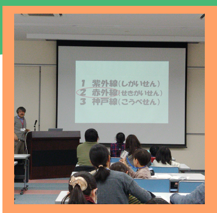
ユーモアたっぷり 安田先生のお話タイム