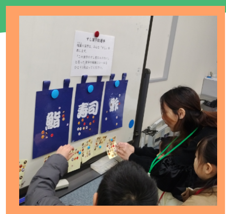
姫路でもやりました！ 「すし漢字総選挙」