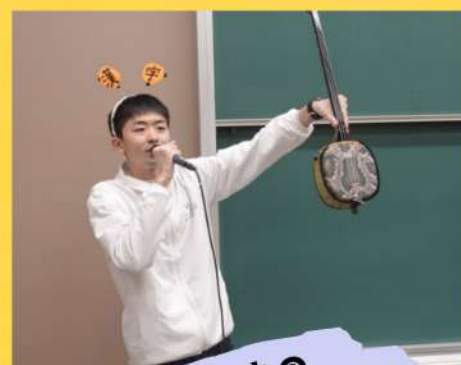
伊藤先生の 漢字クイズ!