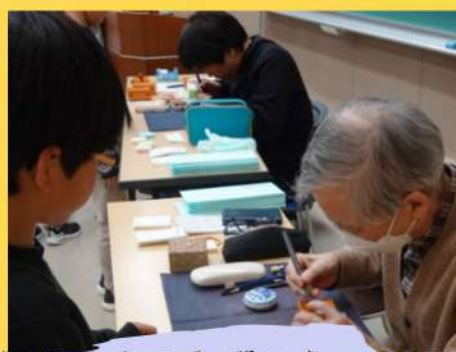
職人さんのわざにうっとり